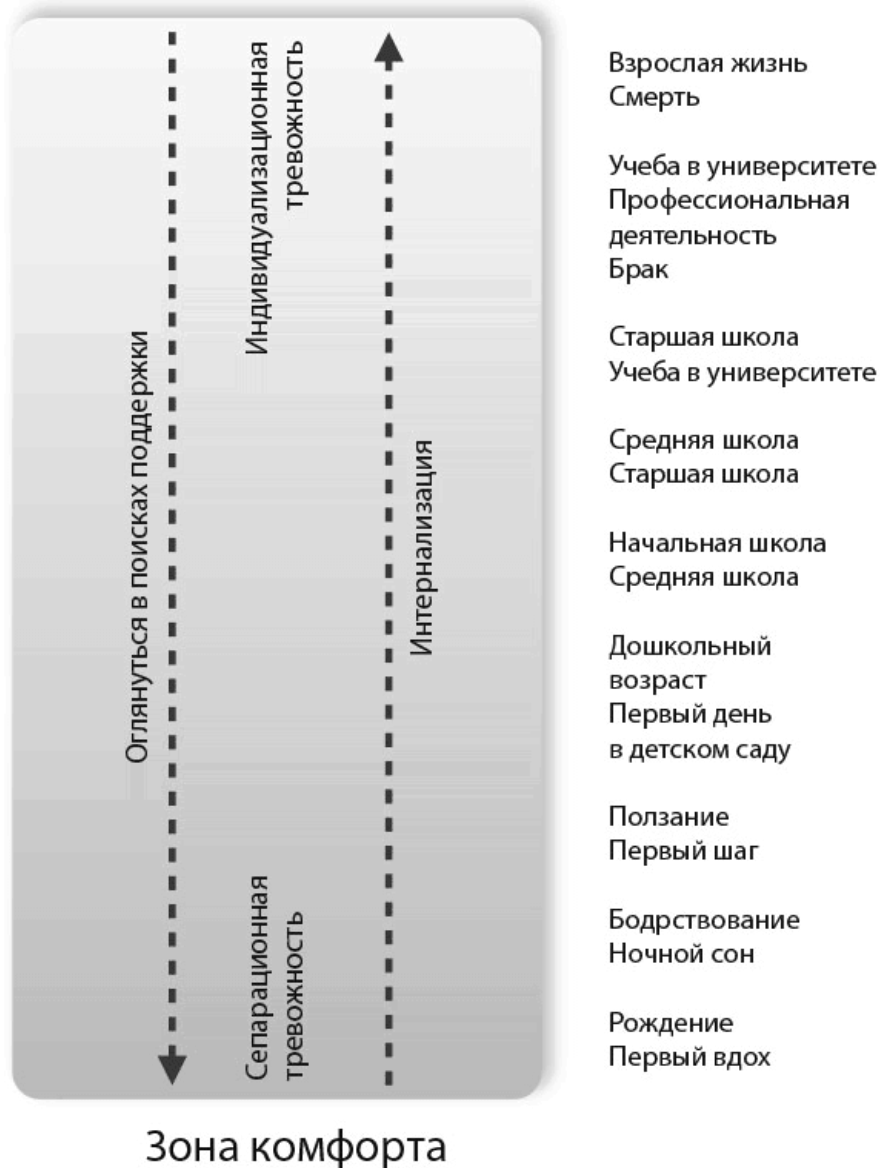
Рис. 2.1. Развитие личности

Но что если в сложный момент мы не получаем нужной поддержки? Перед лицом неизвестности мы теряем уверенность, реже добиваемся успеха, чаще ошибаемся. Получается, что после каждой пары шагов вперед мы делаем уже три шага назад. Усваивая подобную схему поведения, человек теряет способность развиваться и адаптироваться, замыкается в рамках косного триединства основных зон мозга и в результате становится в той или иной степени психом.